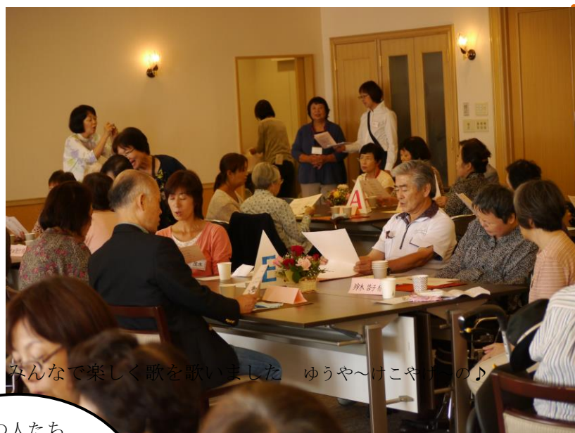
みんなで楽しく歌を歌いました ゆうや〜けこや〜の♪

女の人たちが多くてドキドキしてしまいましたが、窓から江の島が良く見えて景色を見ているうちに和んできました。