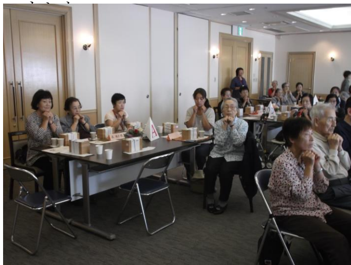
食事の前の口腔体操の様子

ご利用者様20名、付き添いご家族様4名、一心メンバー32名と多くの方にご参加いただきました。最高齢は101歳で90歳以上の方が数名ご参加ください