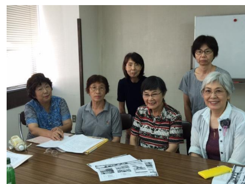
★交流会担当プロジェクト★ 利用者の方とメンバーが楽しんで交流する機会を持っています。ラスカホールで前回好評でしたバイキング形式の食事会をメインにして、みんなで楽しい企画を考えています。