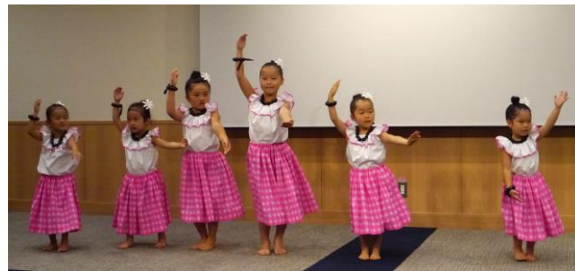
♪可愛いフラダンス♪