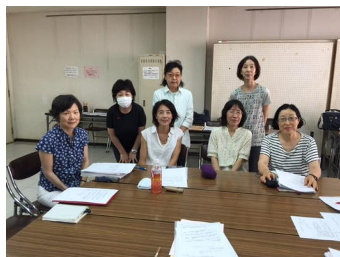
★メンバー拡大プロジェクト★ 一心のメンバー不足を解消すべく、ない知恵をふり絞り頑張って活動しています。お知り合いの方で、仕事をしてみたい人がいましたら、是非紹介して下さい。