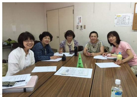
★研修担当プロジェクト★ やるぞ・スキルアップ!!!