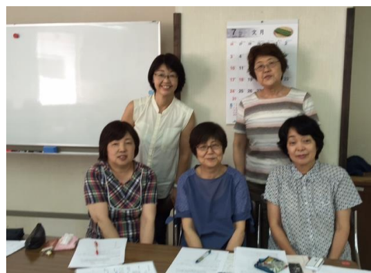
★広報・HP担当プロジェクト★ ねこの手の発行・HPの更新を行っています。ねこの手は年に3回の発行を基本としています。 ホームページもぜひご覧ください。