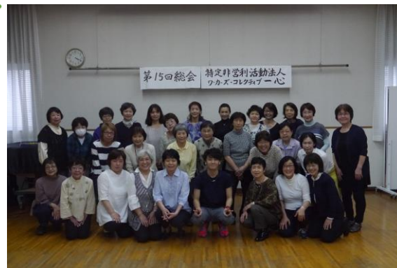
予防体操の講師の方を交えて笑顔いっぱい元気に記念撮影。