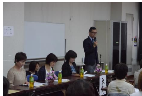
来賓の方、ご出席ありがとうございました。