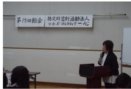
理事長挨拶。緊張の一瞬。