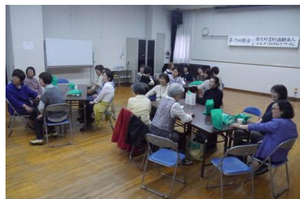
わんはーと♡ 担当者の工夫を凝らした、飲み物とお菓자에癒され、総会と体操の疲れが吹っ飛びました～！