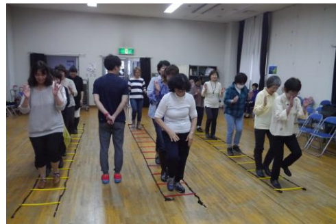
今話題のコグニサイズご存知ですか？脳を活性化させ物忘れ予防のための体操です。