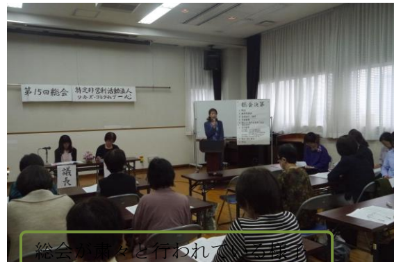
絵会も行われました。