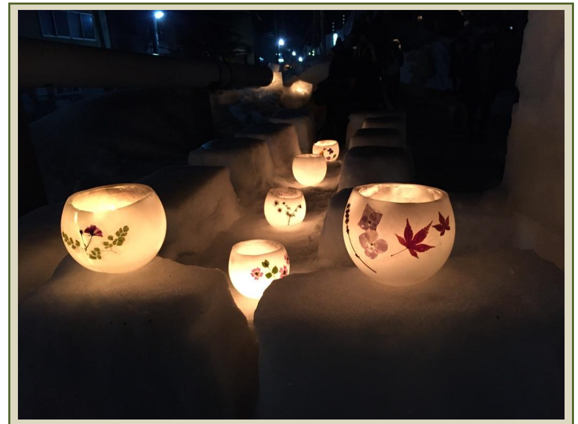
小樽 雪あかりの路