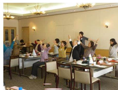
身体を動かして、リフレッシュ